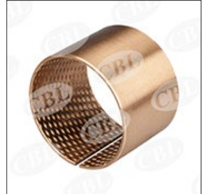
内外倒角 ID and OD chamfers