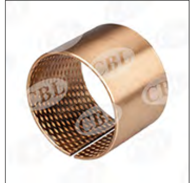
内外倒角 ID and OD chamfers