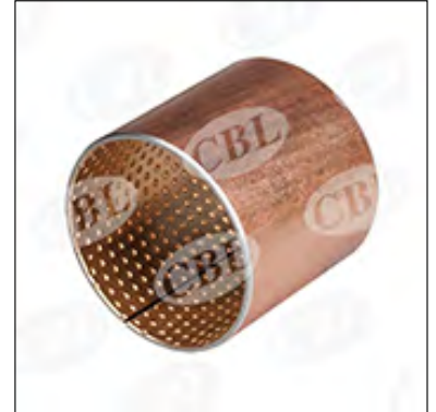
内外倒角 ID and OD chamfers